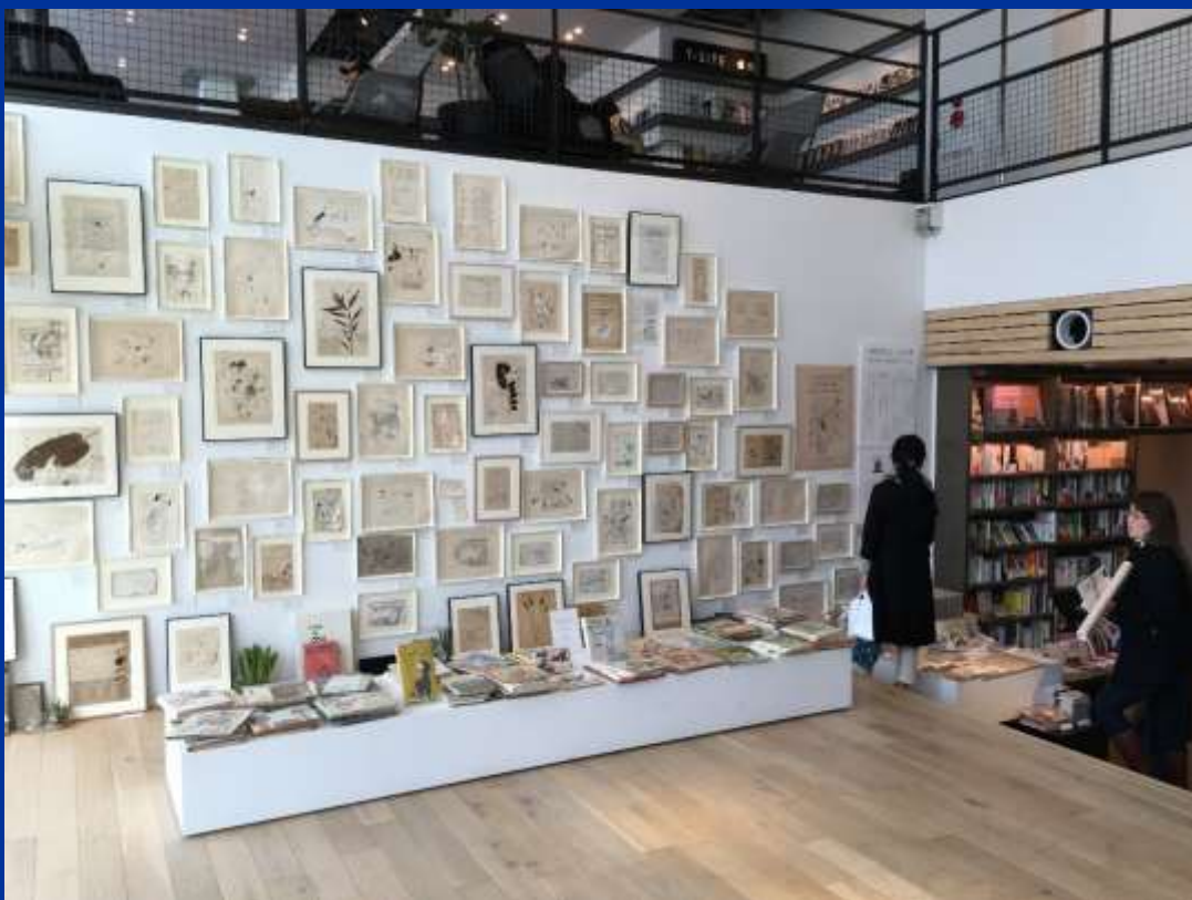
湘南T-SITE 1階と2階を結ぶ位置に写真展など様々な企画を実施

例えば湘南T-SITEのような場所で行いサッカーとは無関係な人にもスタジアムの良さを知ってもらおう